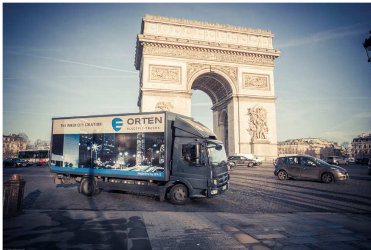
Der ORTEN E 75 TL im Testeinsatz in Paris bei der Firma DACHSER

batteriebetriebenen Trucks bieten völlig neue Chancen der Nachtbelieferung und Kundenbindung.“