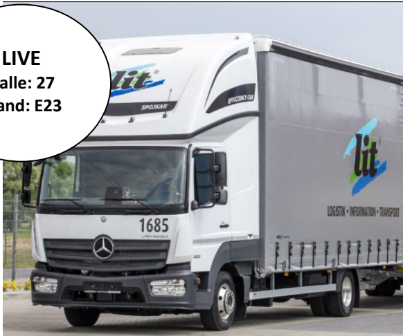
Abbildung des Exponats ORTEN Gniotpol CurtainSafer Ultralight mit Efficiency Cab