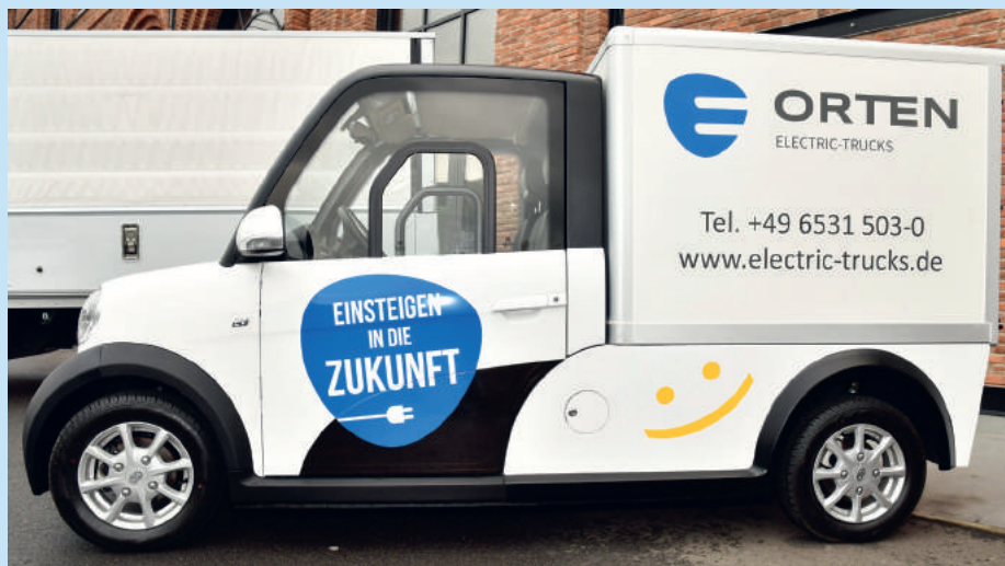
Umgerüsteter Elektro-Kleintransporter für den Lebensmitteltransport

Besonderheiten des voll elektrischen Kühlfahrzeugs ET 35 M sind zum einen der in Leichtbauweise gefertigte 900 kg wiegende Orten-Frischdienst-Kühlaufbau mit Alu-Unterbaukonstruktion und zum anderen die Thermo-King-Kühltechnik. Hinzu kommt eine heckseitige Bär-Cargolift-BC-750-kg-Ladebordwand mit einer faltbaren Plattform in halber Aufbaubreite, die zum Be- und Entla-