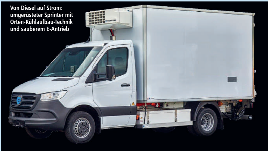
Von Diesel auf Strom: umgerüsteter Sprinter mit Orten-Kühlaufbau-Technik und sauberem E-Antrieb