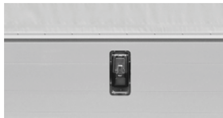
Leichtgängiger, kraftsparender Öffnungsmechanismus